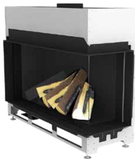
Ekko G R 100 mit Innenauskleidung Stahlblech anthrazit (matt)